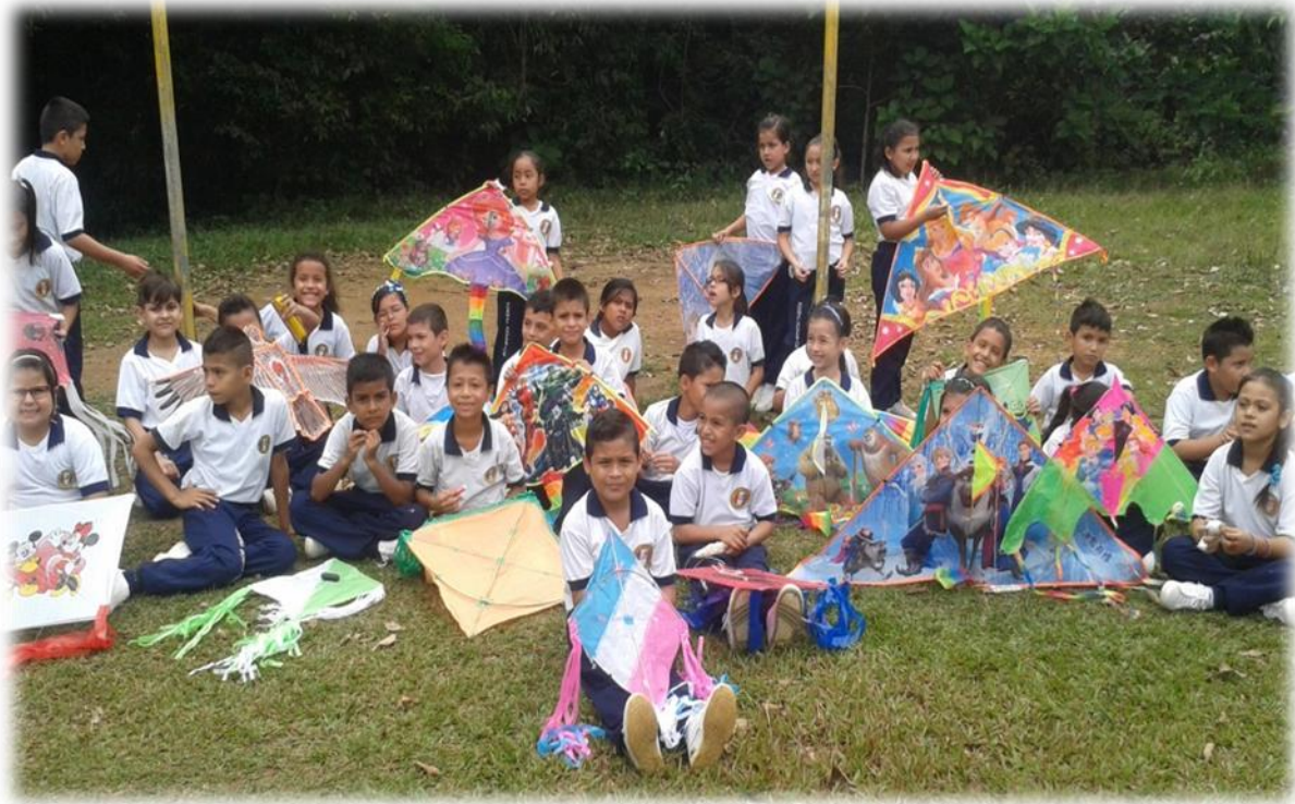
Llegada a la zona verde en la que se desarrolló la integración

Las integraciones fuera del aula de clases son importantes porque además de fortalecer el trabajo en equipo aumenta la relación y adaptación con diferentes entornos.