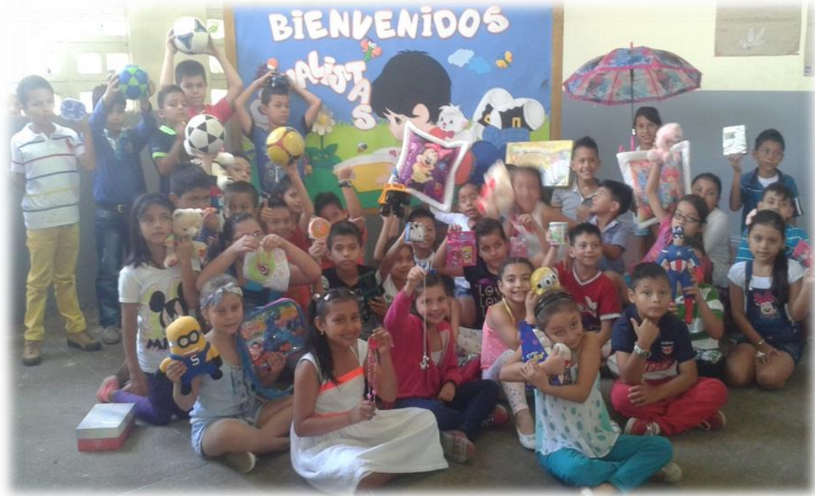
Finalización de la actividad de la entrega de regalos

Integración desarrollada en las dos últimas horas de la jornada escolar en el aula de clase, actividades como estas aumentan las relaciones interpersonales entre estudiantes y maestros.