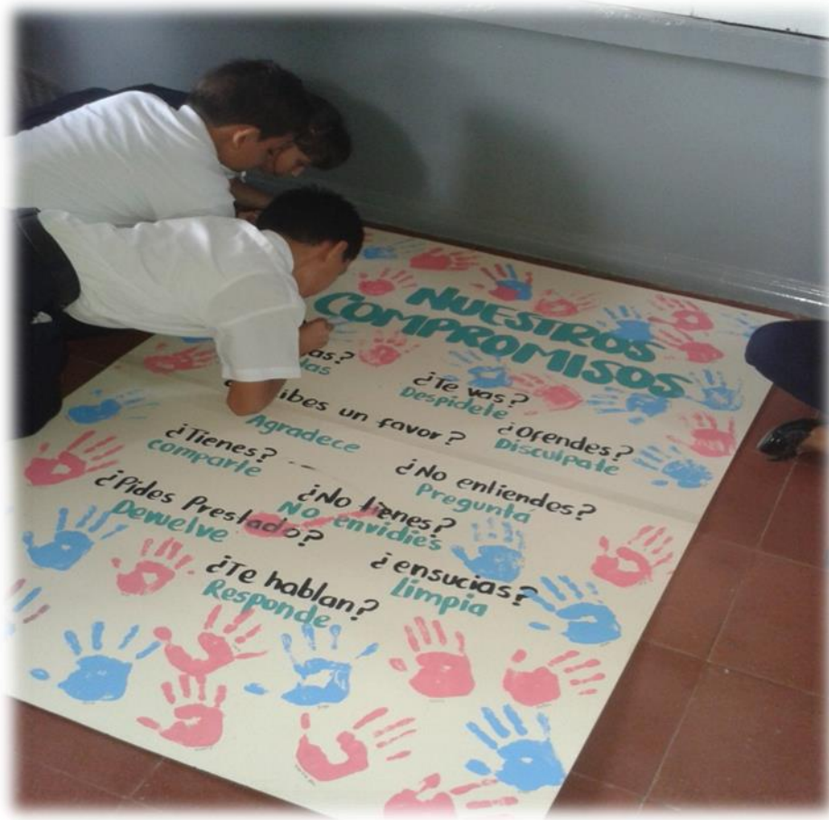
Ejecución de la actividad “Mis compromisos” dentro del aula de clase

La utilización de estrategias didácticas o manualidades ayudan a la disposición para la construcción de compromisos y el cumplimiento de normas básicas de comportamiento.