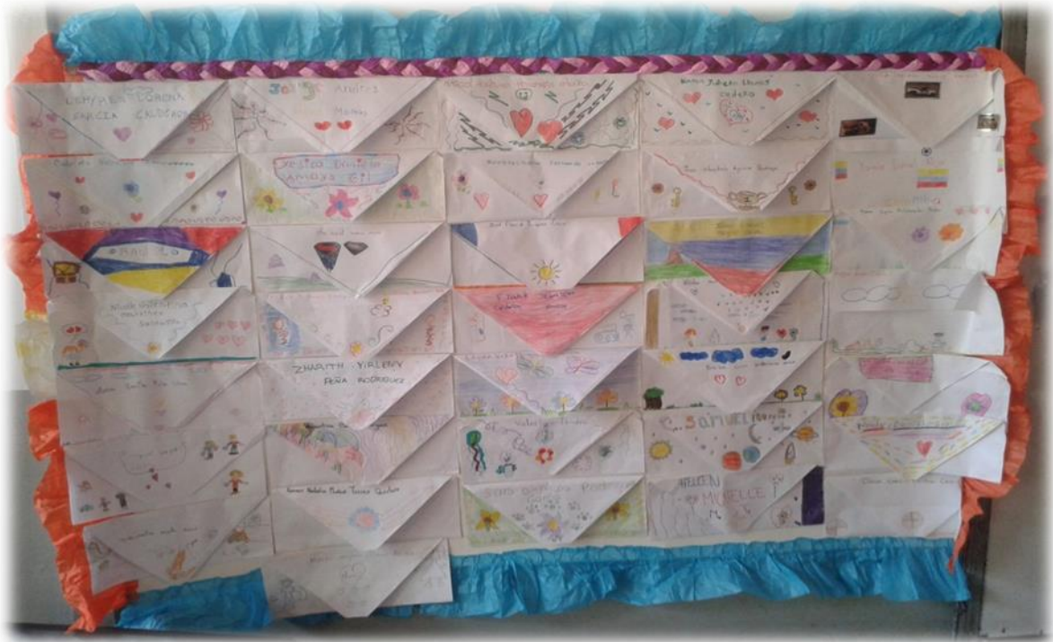
Cartel “El buzo de la amistad” ubicado en el aula de clase

Es importante la utilización de diferentes estrategias que faciliten y aumenten la expresión afectiva en los estudiantes como los mensajes de valoración y agradecimiento que permiten fortalecer el autotestiesma y la confianza en sí.