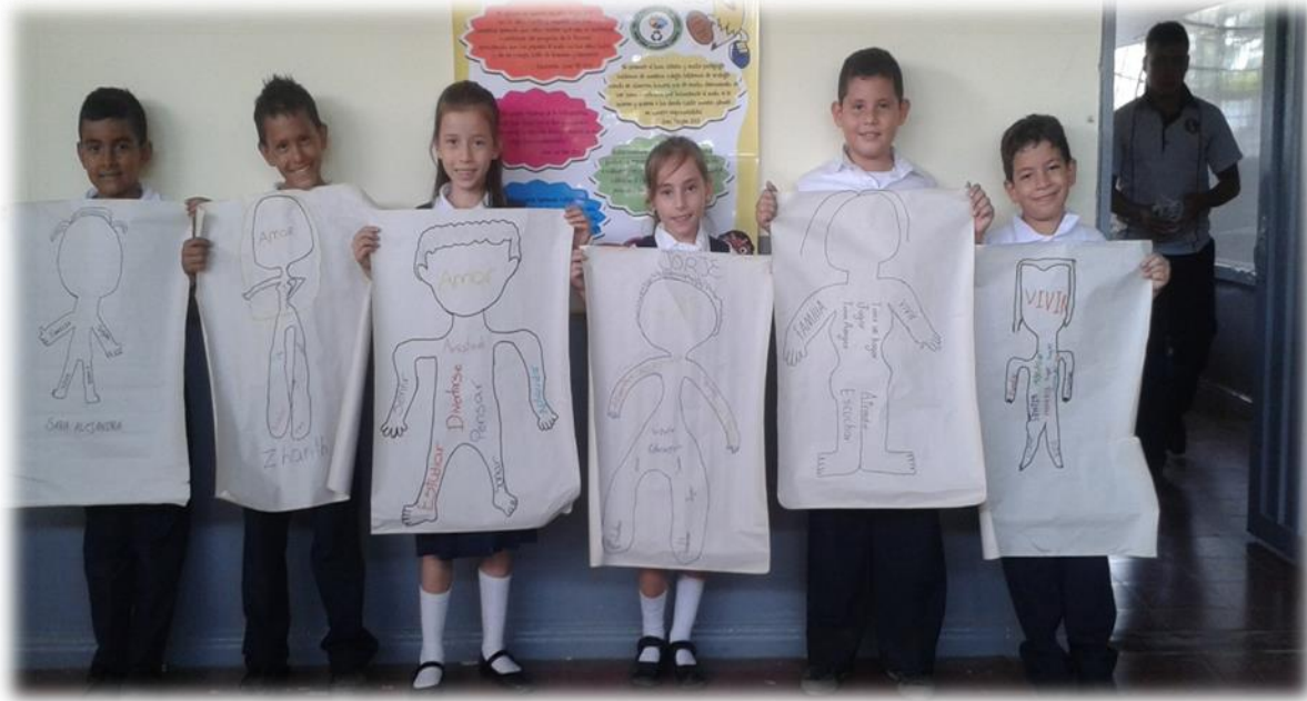
Exposición de algunas siluetas trabajadas en parejas.

Esta actividad se desarrolló con el fin de disminuir el rechazo o empatía entre los estudiantes, la cual tuvo como resultado el reconocimiento por parte de los estudiantes sobre las cosas que nos hacen ser iguales y las que nos hacen ser diferentes en este caso nuestros valores y deberes.