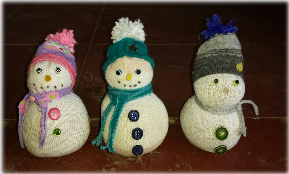
Algunos de los muñecos realizados por los estudiantes

Con esta manualidad se reflejaron bastantes aspectos positivos para la construcción de una cultura de paz como el compartir materiales, ayuda contante para que el trabajo de los demás compañeros quedaran bien hecho y el cuidado del ambiente en el que estaban.