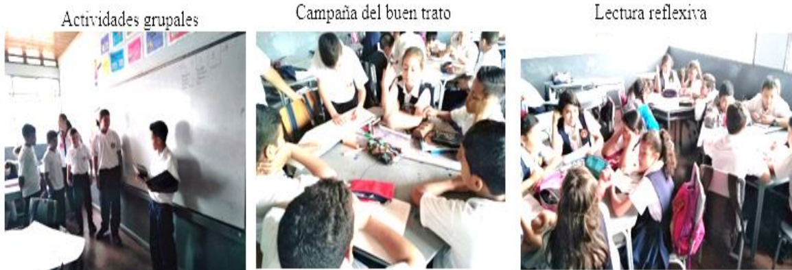
Foto tomada por las autoras sobre las actividades para fortalecer lazos afectivos

Como último aspecto, la escucha activa, se tuvo en cuenta de igual manera las posibles causas encontradas durante la investigación que dieron paso a hallar los problemas tales como: todos querían hablar a la vez, ruido, intervenciones inapropiadas en las clases, falta de atención, distracción, poco respeto hacia el compañero entre otros, estas problemáticas accedieron a planear y aplicar diferentes actividades y estrategias que permitieron fomentar la escucha activa para mejorar los procesos comunicativos, ambientes de aprendizaje y una sana convivencia escolar. Tales como: Acuerdos para la escucha activa, dinámicas (alcanza la estrella) videos reflexivos (nunca digas no puedo) exposiciones, juegos (el teléfono roto), conversatorios entre otros.