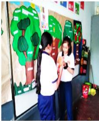
Compromiso al cambio