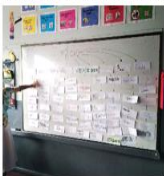
Taller de resolución de conflicto