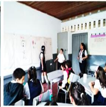
Foto tomada por las autoras para disminuir la violencia física y verbal