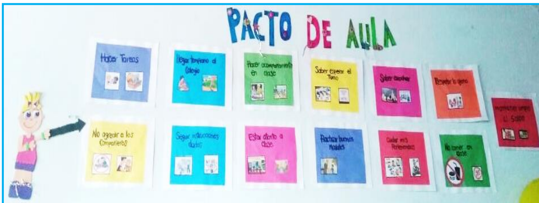
Foto tomada por las autoras sobre los acuerdos establecidos por los estudiantes