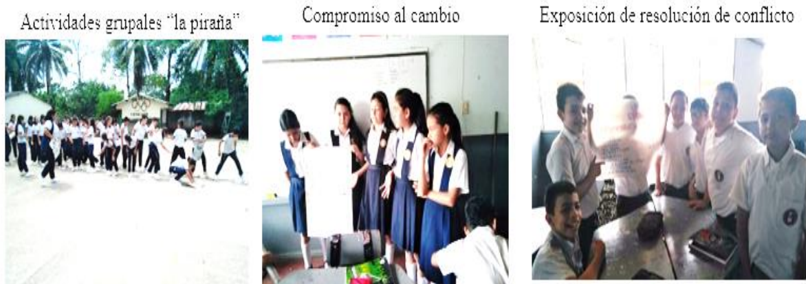
Foto tomada por las autoras para fortalecer y mediar conflictos

Fotos N° 10 Actividades Ausencia de Valores y faltade estrategias para la solución de conflictos