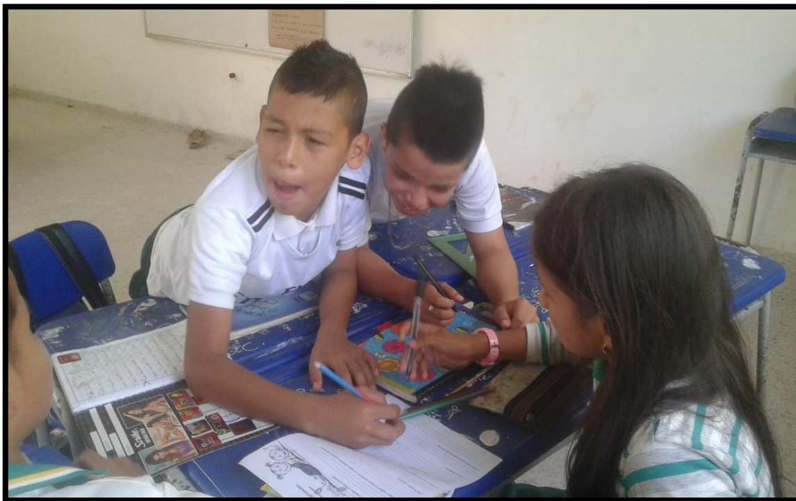
Los grupos respondiendo un cuestionario acerca de cómo solucionar los conflictos asertivamente.