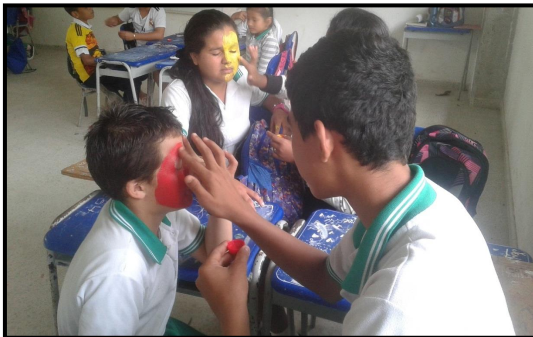
Los estudiantes pintándose la cara de unos a otros lo que genero confianza entre ellos.