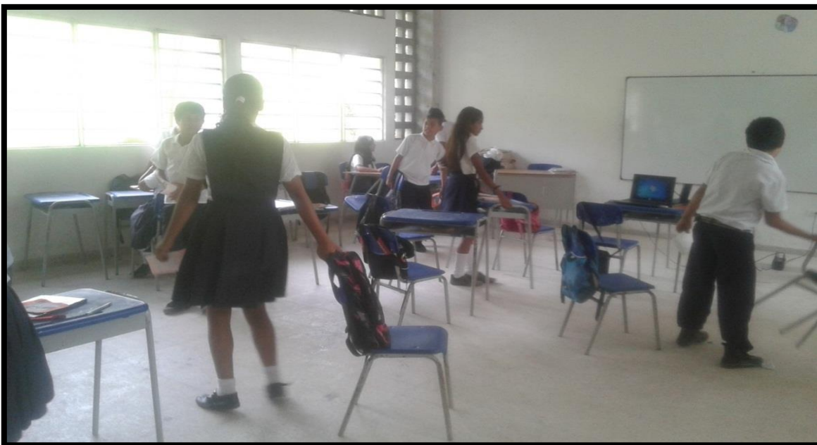
Los estudiantes se encuentran ubicándose en el grupo base que les correspondió.