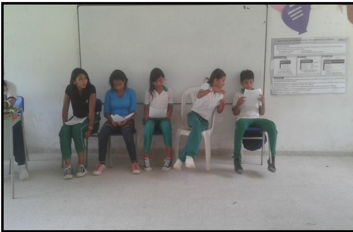
muestran los voceros de cada grupo realizando la técnica reunión de expertos.