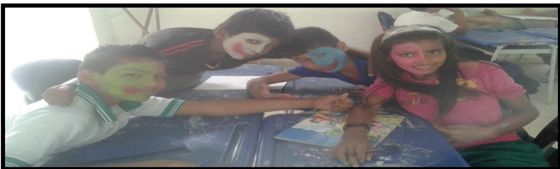
Los Cuatro Turbantes