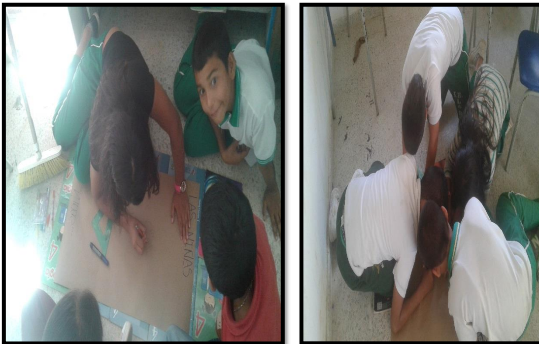
Los grupos realizando la representación gráfica junto la descripción del personaje que les correspondió (niña, niño, hombre, mujer etc)