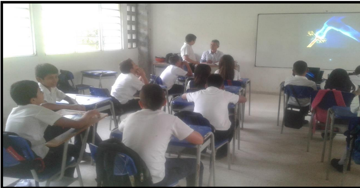
En esta foto se observa los estudiantes del grado quinto del centro educativo Rural Bajo caldas del grado observando el video de “Asamblea en la carpintería”.