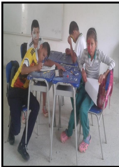
Los estudiantes contentos con su cara pintada y reflexionado acerca de la actividad.