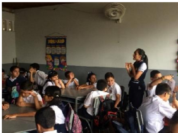
Realización de las encuestas.