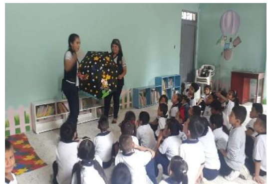
Implementación de estrategia pedagógica sobre la sombrilla en la cual se narra el cuento denominado: “¿a qué sabe la luna?”

Terminadas todas las actividades propuesta en el plan de acción y agotados nuestros tiempos de intervención, se decidió realizar nuevamente la encuesta para evaluar el proceso, retomando la empleada en el inicio de nuestro proceso, a la cual se le hicieron ajustes que permitieran ver los progresos en coherencia con nuestros objetivos propuestos.