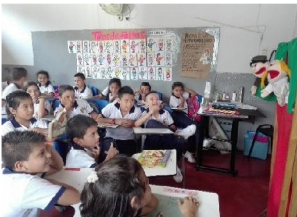
Actividad de motivación.

Para el desarrollo de las encuestas investigativas, los maestros investigadores se dirigieron a cada grado de la Institución, en los cuales se llevaron diferentes actividades y dinámicas de motivación con respecto al proceso de lectura para poder tener un vínculo de confianza con los niños y así establecer una conversación fluida y clara, en donde nos pudimos poner a prueba de credibilidad de los estudiantes, entre las actividades desarrolladas se implementó la estrategia de llevar diferentes clases de cuentos infantiles al aula de clases, en donde fueron ubicados en diversos sitios y espacios del salón, para que los estudiantes pudieran observarlos y elegir los libros que desearan leer, con esta estrategia pudimos evidenciar los tipos de textos más elegidos por los estudiantes, y así poder identificar la clase de lectura por las cuales los niños más se inclinaba.