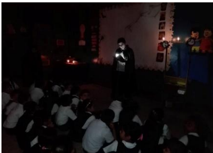
Narración de cuentos infantiles de terror denominado: “el gigante de la montaña”