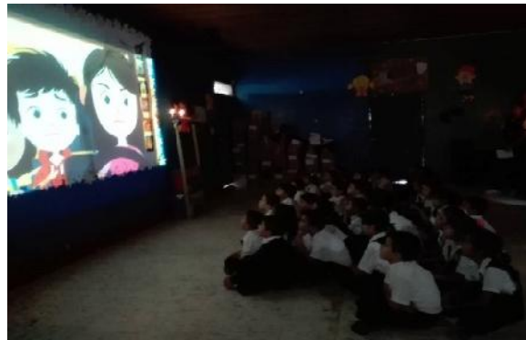
Reproducción de video cuentos infantiles de terror.

Las observaciones y análisis registrados permitieron identificar progreso en los procesos lectores de los estudiantes que se han ido logrando mediante las diversas actividades y dinámicas innovadoras por los maestros en formación implementadas en cada una de las actividades desarrolladas, permitiendo que los estudiantes cambiaran el concepto que tiene con respecto a la cultura por la lectura. Resaltando todos los avances logrados que se han tenido también quedan por decir que aún se presentan inconformidades por parte de los estudiantes con relación a la biblioteca escolar, puesto a que el espacio que se tiene destinado es incómodo por diversas falencias, tales como: las decoraciones y pinturas de los pares que son inapropiadas ya que los colores son tonos oscuros que perjudican la visualidad de las personas que están entre de ella, otra falencia, es la falta de stand, libros y materiales cómodos para las actividades que se desarrollan con los niños.