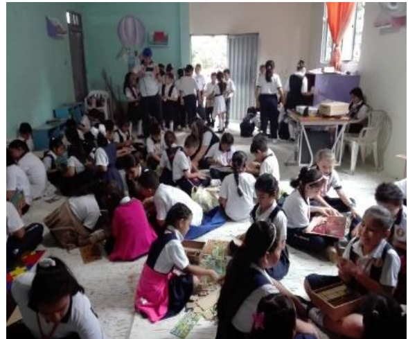
Ingreso de los estudiantes a la biblioteca escolar durante las horas del descanso.