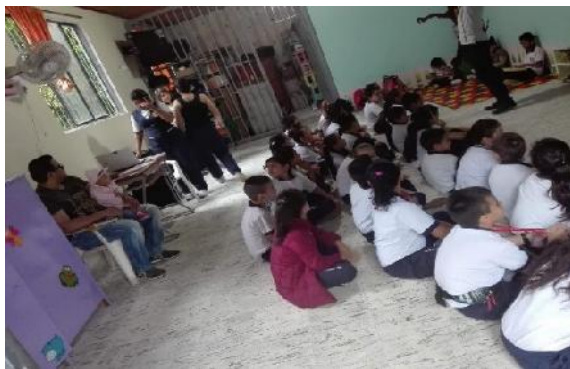
Animación de lecturas durante las intervenciones, y participación de un padre de familia con su bebe, el cual quedo muy contento y motivado con las actividades realizadas.