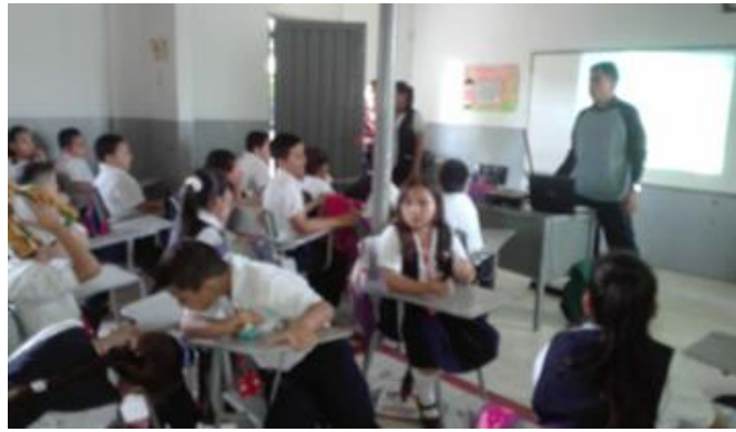
Actividad de lectura en voz alta presentada en pantalla grande grado 4-03

Para recoger datos se emplearon varios instrumentos, uno de ellos fue una ficha de observación que ayudó al registro de los procesos de enseñanza y prácticas lectoras de los estudiantes. Ver anexo instrumento de observación (pág.97).