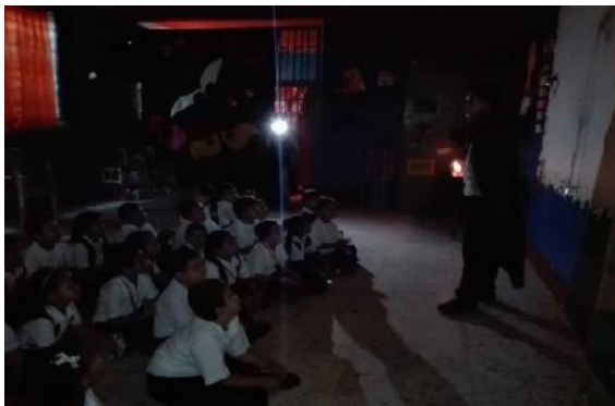
Obras de teatro terroríficas realizadas por los maestros en formación como una.