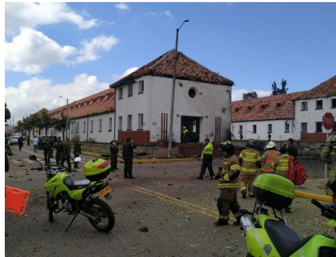
Escuela General Santander.

La noticia que realices debe responder a las cuatro preguntas básicas que está tiene: ¿Qué sucedió?, ¿cómo sucedió?, ¿Cuándo sucedió? ¿Dónde sucedió? Además debes seguir la siguiente estructura: título de la noticia, párrafo de entrada y cuerpo de la información.